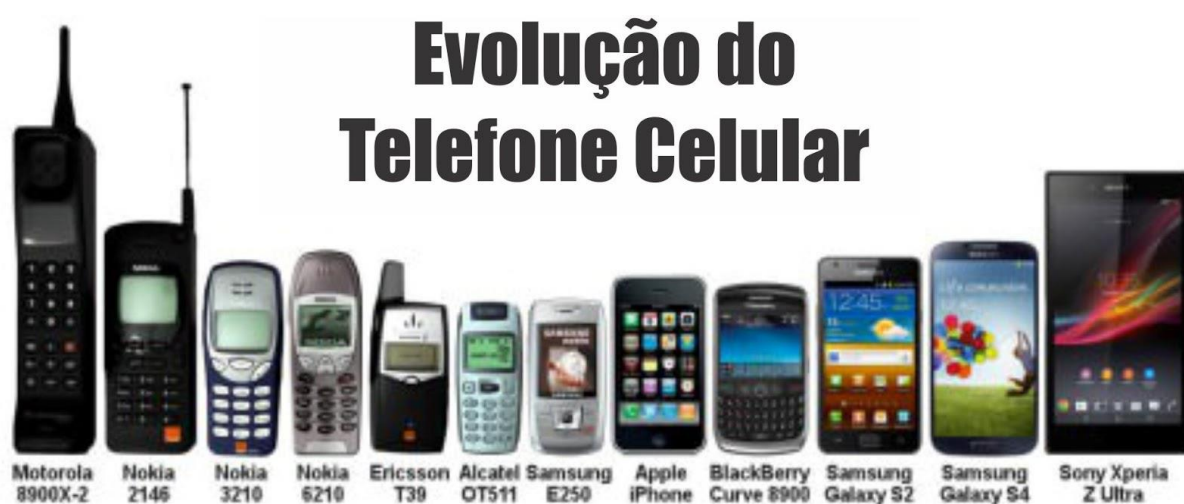
Figura 2 – Representação da evolução dos aparelhos celulares

Como as necessidades dos clientes são constantes, tornando os projetos de melhoria cada vez mais necessários para a continuidade do negócio, percebeu-se que os clientes não estavam mais satisfeitos com o modelo de aparelho celular pequeno e com grandes recursos, percebeu-se então a necessidade de novos projetos para atualização e atendimento de novas demandas de clientes.