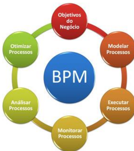
Figura 3 – Representação de atividades voltadas ao BPM

Porém, este aumento e necessidade de melhorias nos produtos comercializados ou até mesmo na forma em que os produtos são construídos, também temos a necessidade de uma metodologia de fácil absorção e entendimento por parte das equipes de produção e estratégia da organização para auxiliar e gerir os projetos de forma que sejam alcançados os melhores resultados, pensando nisso surgiu o conceito de escritório de processos (BPM) com suas ferramentas e recursos necessários para a melhor gestão de produtos (projetos), auxiliando no atingimento da excelência no atendimento aos clientes.