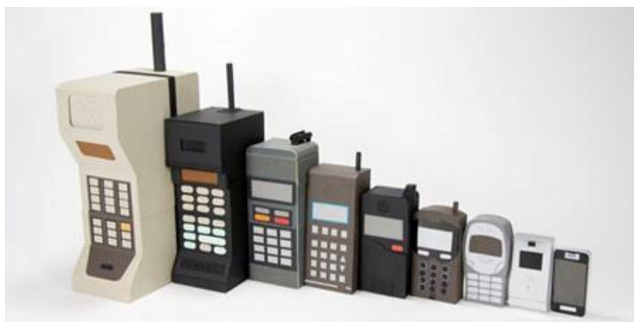
Figura 1 – Representação em série da evolução dos primeiros aparelhos celulares Fonte: http://blog.ibacana.com.br/celulares-bem-diferentes/ (2012).

Em um processo produtivo e competitivo para seu destaque e também para a sua manutenção no mercado de consumo, as organizações necessitam dia após dia da busca permanente por conhecimentos e melhorias em seus produtos e serviços oferecidos aos seus clientes, pensando nisso temos a necessidade de novos projetos de melhorias para os produtos já existentes nas organizações principalmente se pensarmos que o mercado é muito dinâmico, nossos clientes internos e externos são muito dinâmicos e cada vez mais exigentes, e as necessidades de nossos clientes estão em constante modificação, um exemplo disso são os aparelhos de telefonia celular, os primeiros aparelhos eram gigantes, quadrados, com poucos recursos e pesados, mas todos queriam possuir uma dessas maravilhas tecnológicas.